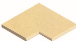
Element Ecke 90°