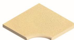
Element Innenwinkel R15