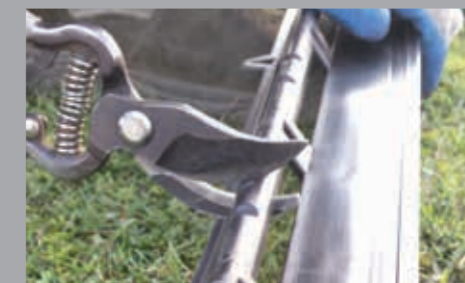
Durch Entfernen der Koppler kann das Profilelement biegsam gemacht werden.