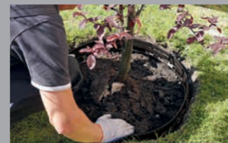
... bestimmen Sie die exakte Form, ...