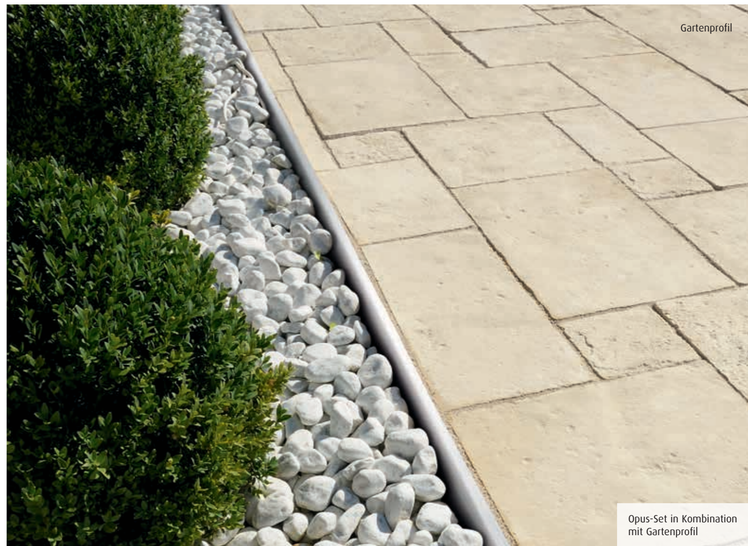
Opus-Set in Kombination mit Gartenprofil