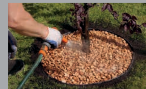
... die dank unserer Profile dauerhaft erhalten bleibt.