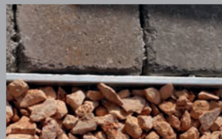
Grenzen Sie Schotterflächen und Steine sauber voneinander ab.