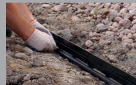
Anbringung von Strom- oder Bewässerungsleitungen ohne zusätzliche Elemente.